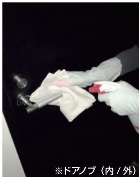
※ドアノブ (内 / 外)

特に客室掃除は、 毎回隅々まで消毒・換気を徹底し 、衛生管理の強化を行なっております。